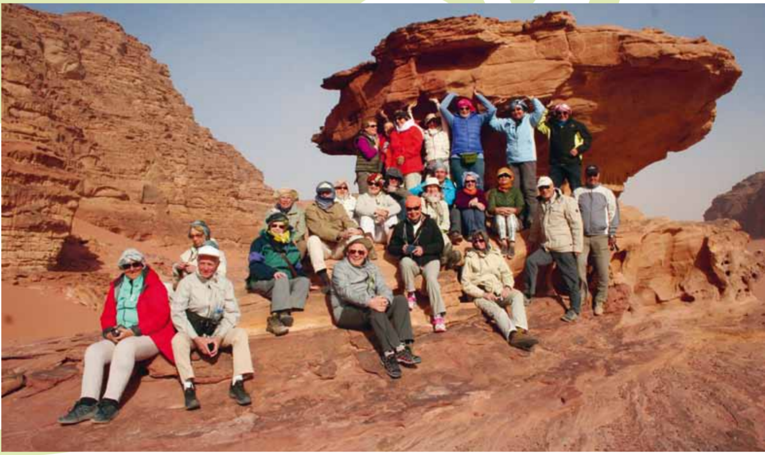
Außergewöhnliche Reiserlebnisse mit der Familienbildung / Jordanien 2015